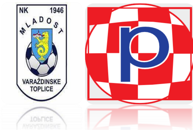
Tablica 6. Podaci o rashodima Grada Varaždinskih Toplica, po osnovi upravljanja i raspolaganja nogometnim igralištima u vlasništvu Grada Varaždinskih Toplica u 2021. i 2022. godini.